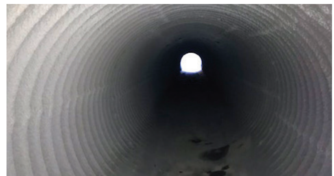
Metallwellrohr saniert mit dem Quadex Auskleidungssystem