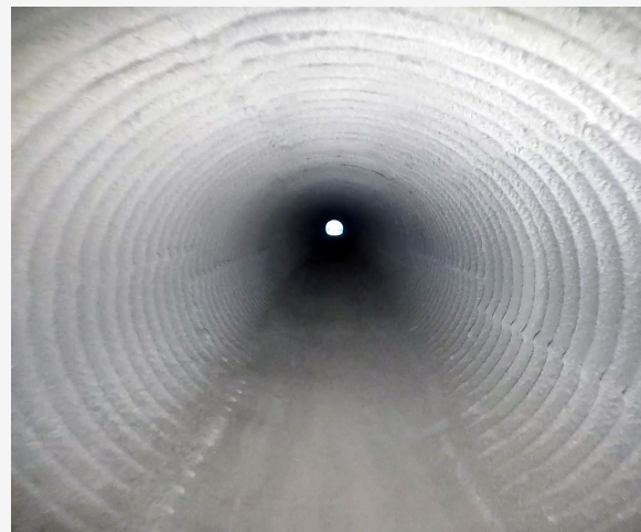
Die Inspektion des mit GeoKrete ausgekleideten Durchlasses nach dem Einbau zeigt die Präzision und Sauberkeit der Anwendung.