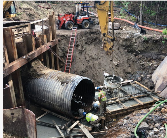
Der Durchlass des NHDOT erforderte eine erhebliche Verstärkung als Teil des gesamten Sanierungsprozesses.

Bei diesem Projekt war ein Umleitungssystem erforderlich, um den Bach und den Regenwasserstrom umzuleiten. Nach der Inbetriebnahme wurde der Durchlass gereinigt, Schutt entfernt und umfangreiche Reparaturen an der Sohle durchgeführt. Außerdem wurden die fehlenden Rohrabschnitte (auf 3 Uhr und 9 Uhr) repariert. Normalerweise werden diese Hohlräume vor dem Auskleiden der Rohre mit einem Bewehrungsgitter oder einem Gitter in Kombination mit handgezogenem GeoKrete® ausgefüllt. Anschließend wurde GeoKrete im Präzisionsschleudergussverfahren in einer Stärke von 2 Zoll hergestellt. Das abgeschlossene Projekt erfüllte alle Ziele und Anforderungen, die vor der Reparatur festgelegt wurden, und war die erste genehmigte und abgeschlossene GeoKrete Geopolymer-Auskleidung, die vom Verkehrsministerium von New Hampshire installiert wurde.