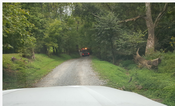
Abgelegener Zugang und schmale Wege.