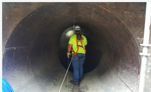
Blick auf den steilen Hang der Druckrohrleitung hinunter.