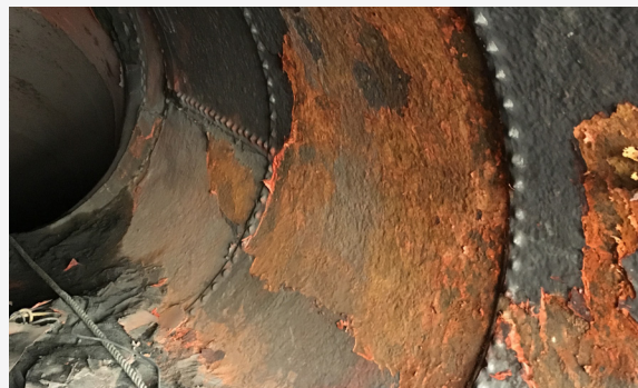
Die Entfernung von Urathan war mühsam.

Abschließend lässt sich sagen, dass sich AEP zwar ursprünglich wegen der Leistungseigenschaften von GeoKrete für QLS entschieden hat, dass aber auch die hohe Sicherheit des QLS-Teams ein Faktor war. Diese Installation erwies sich aufgrund der extremen Hangneigung als Herausforderung. Sicherheit, Achtsamkeit und besondere Aufmerksamkeit beim Anlegen der Gurte waren von größter Bedeutung.