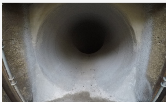
GeoKrete Liner - Strukturelle Erneuerung und Wiederherstellung der Fließfähigkeit.