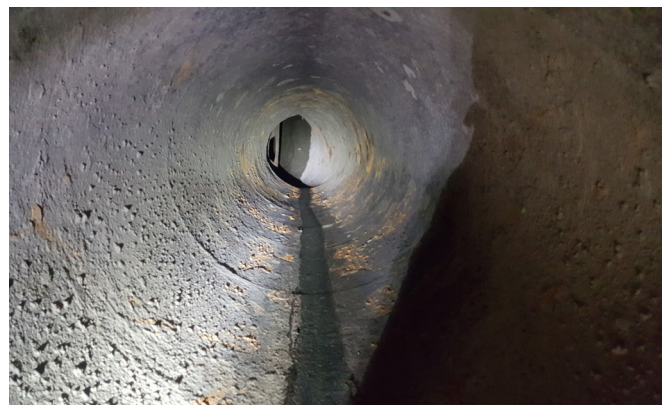
Außenansicht der 45° abgewinkelten Druckrohrleitungen.

Das Quadex Lining System® (QLS) Schleudergussverfahren hingegen benötigt eine viel kleinere Stellfläche und verfügt über einen äußerst tragbaren, speziell entwickelten Anwendungsschlitten. Aufgrund der Fähigkeit des GeoKrete- Materials, über längere Strecken gepumpt zu werden.